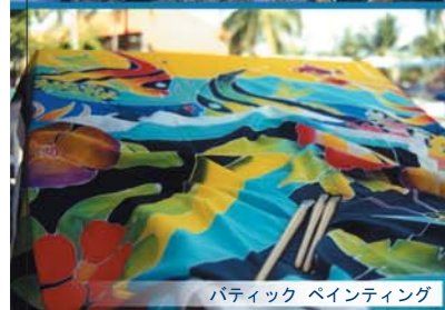
バティック ペインティング